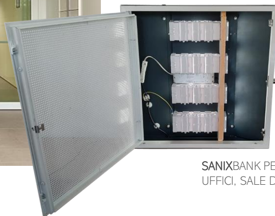
SANIXBANK PER AREE SELF, UFFICI, SALE D'ATTESA, SERVIZI