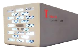
SANIXBANK PER BUSSOLE E ASCENSORI