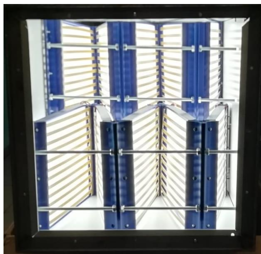
Filtro BIO-AIR in funzione

Per la realizzazione di questo filtro, sono stati scelti appositi LED (per indurre la fotocatalisi) che garantiscono il minor consumo energetico. Sono stati selezionati materiali plastici innovativi che, oltre alle richiamate caratteristiche di leggerezza e flessibilità di installazione, assicurano un'elevata circolarità industriale e la massima riduzione di impatto ambientale con facilità di smaltimento.