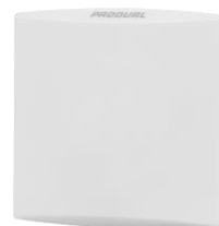
T BOX METEO Master / Slave