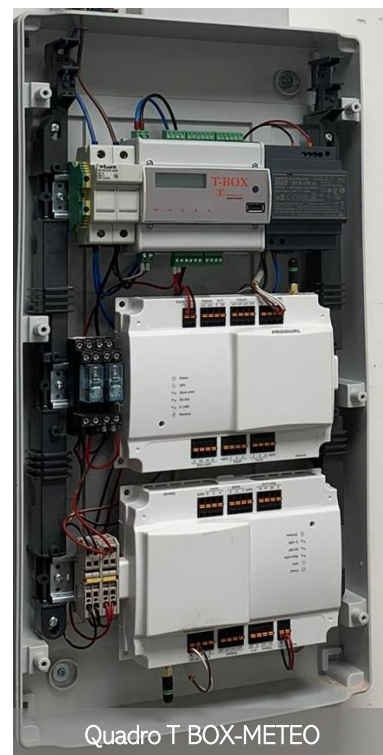
Quadro T BOX-METEO

Tale sistema si avvale di un brevetto rilasciato in Italia, Europa e USA e permette di garantire, all'interno degli edifici, temperature di comfort costanti generando contestualmente risparmi che possono arrivare dal 15% al 30% della bolletta dal giorno successivo l'attivazione