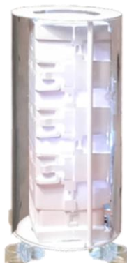
SANIXHOTEL DA TAVOLO