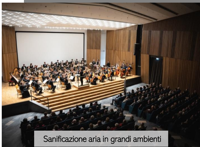
Sanificazione aria in grandi ambienti

TONALI E.A. nasce nel 2019 da una sinergia pluriennale con BlackBox Green (società del gruppo). TEA fornisce sistemi integrati dedicati all' efficientamento energetico e al monitoraggio dell'ambiente per la salvaguardia del territorio e delle persone.