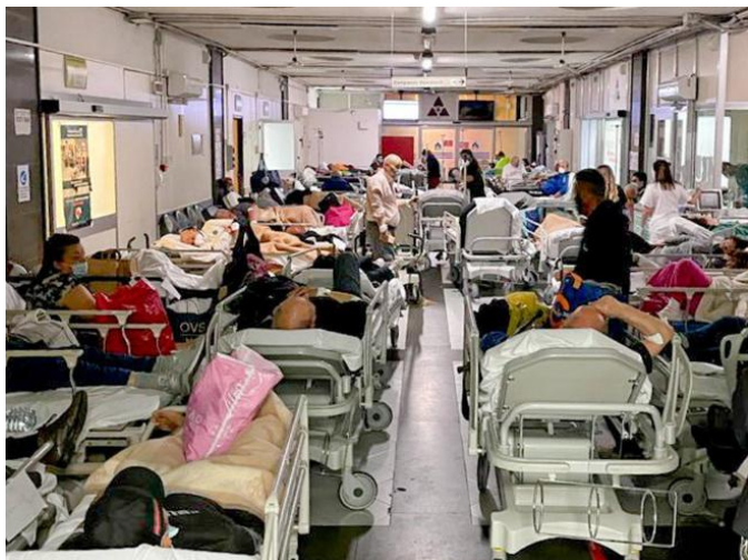
Sala attesa Pronto Soccorso

TONALI E.A. offre sistemi di sanificazione degli ambienti indoor atti a garantire un'aria di qualità e ridurre al minimo i rischi di contaminazione da virus, batteri e gas che causano malattie, inquinamento e cattivi odori. Con i prodotti T BIO-AIR (abbattimento di virus e batteri) e T BIO-GAS (specifico per gas) proponiamo al mercato soluzioni efficaci e certificate di depurazione dell'aria a ciclo continuo avanzato (c.ca 4000 mc/h a velocità aria 3 m/s) per grandi ambienti.