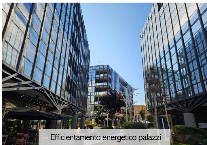
Efficientamento energetico palazzi